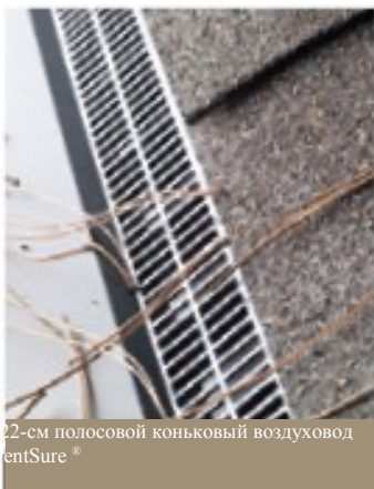
122-см полосовой коньковый воздухопровод VentSure®

Независимо от того, низкий наклон у Вашей крыши или крутой, новые 122-см полосовые коньковые воздухопроводы VentSure легко гнутся, создавая более равномерную линию конька.