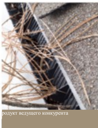
продукт ведущего конкурента

В отличие от конкурирующей продукции, 122-см полосовые коньковые воздухопроводы VentSure отличаются уникальной конструкцией перегородки, которая усиливает воздушный поток, предотвращая скопление органических остатков в жалюзийной структуре.