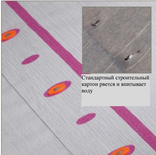
Стандартный строительный картон рвется и впитывает воду